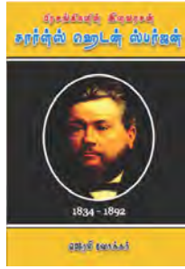
சார்ள்ஸ் ஹெடன் ஸ்பர்ஜன்