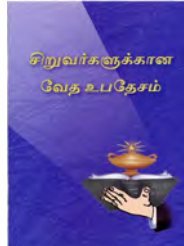
சிறுவர்களுக்கான வேத உபதேசம்