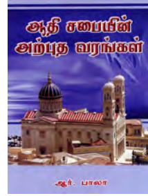
ஆதிசபையின் அற்புத வரங்கள்