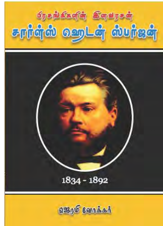
சார்ள்ஸ் ஹெடன் ஸ்பர்ஜன்