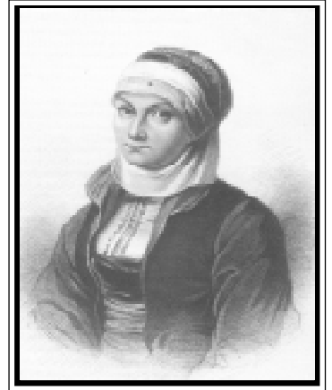
முன் அட்டையில் கேட்டி

மார்டின் லூதருடைய வாழ்க்கையில் திருமணம் எதிர்பாராதவிதமாகவே நடந்தது. கத்தோலிக்க மடத்தில் இருந்து பெண்கள் தப்புவதற்காக லூதர் உதவி வந்தார். அவ்வாறு ஒரு முறை அவர் உதவி செய்த பெண்கள் குழுவில் கெத்தரின் வான் போரா இருந்தார். லூதர் கெத்தரினை தனது நண்பர்களில் ஒருவருக்கு மணமுடித்து வைப்பதில் பெரு முயற்சி செய்தார். ஆனால், கெத்தரின் அவரைத் திருமணமுடிக்க மறுத்து லூதரை மணமுடிப்பதில் ஆர்வம் காட்டினார். இறுதியில் லூதரே கெத்தரினை மணமுடித்தார். லூதரின் திருமணத்தில் ஐரோப்பா முழுவதுமே ஆர்வம் காட்டியது. அதை எதிர்த்துப் பலித்துப் பேசியவர்களும் அநேகம். ஆனால், லூதர் எல்லையில்லாத மகிழ்ச்சி வெள்ளத்தில் ஆழ்ந்தார். லூதர் ஆசையாக தனது அன்பு மனைவியை எப்போதும் கேட்டி என்று கூப்பிடுவது வழக்கம். கேட்டி லூதரின் வாழ்வில் பெரு மாருதல்களைக் கொண்டு வந்தார். திருமணத்திற்கு முன் லூதரின் வேலை மிகுதியால் ஒரு வருடம் அவருடைய கட்டில் சீர் செய்யப்படாமல் இருந்தது. இந்நிலைமையில் கேட்டியின் வருகை லூதருக்கு எத்தகைய சந்தோசத்தை அளித்திருக்கும்.