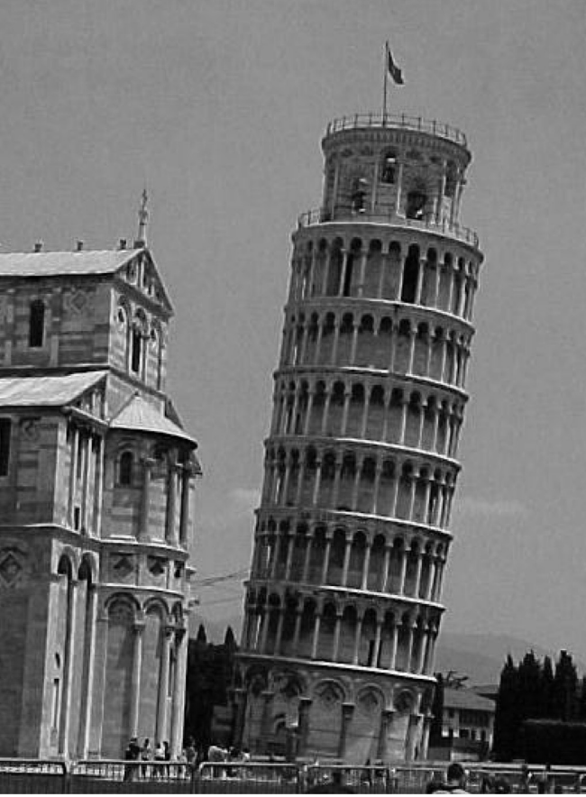
இத்தாலியின் பீசா கோபுரம்

மெய்க் கிறிஸ்தவர்களின் தொகையும், நல்ல சபைகளின் எண்ணிக்கையும் துளியளவே என்பது நம்மில் அனைவரும் ஒப்புக்கொள்ளுகிற ஒரு விஷயந்தான். வலது கைக்கும் இடது கைக்கும் வித்தியாசம் தெரியாதவர்களாகத்தான் கிறிஸ்தவர்கள் என்ற பெயரில் இருக்கும் பெரும்பாலானவர்கள் தொடர்ந்து இருந்து வருகிறார்கள். சமீபத்தில் நான் தமிழகத்தில் ஓரிடத்துக்கு பயணம் செய்து கொண்டிருந்தபோது வண்டியோட்டியவர் என்னோடு ஆவிக்குரிய விஷயங்களைப் பற்றிப் பேச ஆரம்பித்தார். அவர் கிறிஸ்தவர் என்பது முதலில் எனக்குத் தெரியாது. கிறிஸ்தவர் என்று தெரிந்தவுடன் ஆர்வத்தோடு வேத விஷயங்களைப் பற்றி பேச ஆரம்பித்தேன். நேரம் போவதும் தெரியவில்லை. என்னுடைய பிரசங்கத்தை முதன் முறையாக அன்றைக்கு கேட்டிருந்த அவர், 'இந்த மாதிரிதான் ஐயா, வேதத்தை விளக்கிப் போதிக்க வேண்டும். இது போன்ற போதனைகள் எனக்குக் கிடைப்பதில்லை' என்றார். ஏன்? என்று நான்