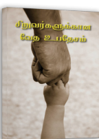
சிறுவர்களுக்கான வேத உபதேசம்