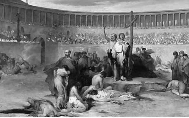
ரோம அரசர்களால் கிறிஸ்தவர்கள் துன்புறுத்தப்படும் காட்சி

வனவிலங்குகள் அவர்களைக் கொன்று தின்னும்படி அவைகள் முன்னால் தூக்கி எறியும்படிச் செய்தான். தன்னுடைய தோட்டத்தில் இரவு நேர விருந்துபுசாரங்களின்போது கிறிஸ்தவர்களைக் கம்பத்தில் உயிரோடு கட்டி எண்ணை ஊற்றி எரித்து விளக்குக் கம்பங்களாகப் பயன்படுத்தினான் நீரோ. மிகக் கொடூரமாக கிறிஸ்தவர்களை நடத்தியவன் நீரோ.