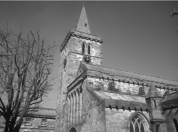
ஜோன் நொக்ஸ் முதல் முதல் பிரசங்கித்த திருச்சபை கட்டிடம்

செயின்ட் அண்ட்ரூசில் துணைப்பேராசிரியராக பணிபுரிந்தபோது நொக்லைச் சுற்றி ஓர் இளைஞர் கூட்டம் இருந்தது. அவர்களுக்கு வேதத்தைக் கற்றுக் கொடுத்தார் நொக்ஸ். நொக்ஸின் போதிக்கும் திறமை பலருடைய காதுகளையும் எட்ட இன்னும் பலர் அவரிடம் வேதம் கற்றுக்கொள்ள வந்திணைந்தனர். அண்ட்ரூஸில் கூடிய சபை நொக்லைப் பிரசங்கம் செய்யும் படியாக அழைத்தது. அந்தளவுக்கு வேதத்தைப் போதிக்கும் நொக்ஸின் திறமை எல்லோரையும் கவர்ந்திருந்தது. பிரசங்க அழைப்பு கிடைத்தபோதும் நொக்ஸ் அதை ஏற்றுக்கொள்ளத் தயங்கி ஜெபித்தார். கர்த்தர் அனுமதிக்காத, அழைக்காத பணியை ஏற்றுக்கொள்ள அவர் விரும்பவில்லை. கர்த்தர் அதைத்தான் செய்ய அனுமதிக்கிறார் என்பதை உறுதியாக உணர்ந்தபிறகே அண்ட்ரூஸில் பிரசங்கிக்கும் அழைப்பையும், பணியையும் நொக்ஸ் ஏற்றுக் கொண்டார். தன்னுடைய இறுதிக்காலம்வரை இங்கு நொக்ஸ் கிறிஸ்துவின் மகிமையான சவிசேஷத்தை அதிரடியாகப் பிரசங்கித்து ஸ்கொட்லாந்து திருச்சபை சீர்திருத்தத்தை அடைய முன்னோடியாக இருந்தார்.