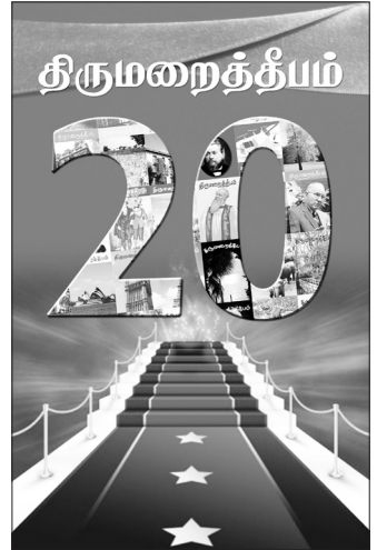
திருமறைத்தீபத்தின் 20வது ஆண்டு நிறைவு விழா இதழ் ஜனவரி 2015

இந்த வருட ஆரம்பத்தில் இருந்து திருமறைத்தீபத்தை அச்சிடும் பணி இந்தியாவுக்கு மாற்றப்பட்டது. இந்திய வாசகர்களே அதிகமானவர்களாக இருப்பதால் அவர்களை இலகுவாக சென்றடையவும், இதழ்குழுவோடு அவர்கள் இலகுவாகத் தொடர்புகொள்ளவும் இந்த மாற்றத்தைச் செய்ய ஒப்புக்கொண்டோம். இந்தியாவில் நம்மோடு இணைந்துழைக்கும் அருமை நண்பர்களுக்கு எமது நன்றிகள்! ஸ்ரீ லங்காவில் இதழை அச்சிட்டு விநியோகித்து வருகிறவர்களுக்கும் எங்கள் நன்றிகள்! திருமறைத்தீபத்தை வந்துபோய்க் கொண்டிருக்கிற எல்லா இதழ்களையும் போல் பார்க்காமல் அதன் தனித்துவத்தை உணர்ந்து வாசித்துப் பயன்பெற்று வரும் வாசகர்களுக்கு இதழ்குழு தன் நன்றியைத் தெரிவித்துக்கொள்ளுகிறது. பெரியவர்களில் இருந்து 21ம் நூற்றாண்டு வாலிபர்கள்வரை வாசகர்களை எட்டியிருக்கிறது இதழ். இதழ் மீது அதீத காதல்கொண்டு வாசித்து வருகிறவர்களையும் நான்றிவேன். உங்களுக்கெல்லாம் தொடர்ந்தும் சத்தியத்தை சத்தியமாக எழுதி வெளியிட்டு கர்த்தரின் பாதையைக் காட்டும் இந்தப்பணியில் தளர்வடையாமல் நாங்கள் தொடர எங்களுக்காகவும் ஜெபித்துக் கொள்ளுங்கள்.