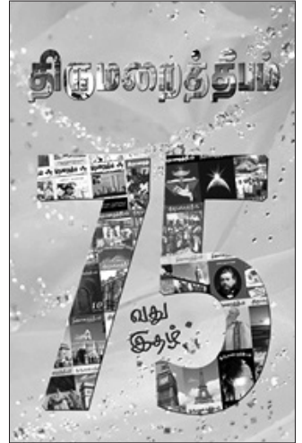
திருமறைத்தீபத்தின் 75வது இதழ் அக்டோபர் 2014