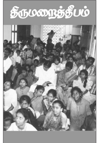
வடிவம் மாற்றப்பட்ட திருமறைத்தீபத்தின் முதல் இதழ் ஜனவரி 2002

இந்த வசனத்தில் இரண்டு வார்த்தைப்பிரயோகங்களைக் கவனிப்பது அவசியமாகிறது. முதலாவது to tamper with God's word. இதையே வேதத்தை வைத்து விபச்சாரம் செய்வது என்று சொன்னேன். அந்தவிதத்திலேயே KJV, NKJV, NASB போன்ற ஆங்கில மொழிபெயர்ப்புகள் மொழிபெயர்த்திருக்கின்றன. அவை இதை adultrating the word of God என்று மொழிபெயர்த்திருக்கின்றன. இதன் கிரேக்க மூலம் அந்த அர்த்தத்தையே கொண்டிருக்கிறது. அதாவது, மெய்யான வசனத்தைத் திரித்துப் பொய்யானதாக மாற்றுவது என்று அதற்கு அர்த்தம். ஒரு விபச்சாரி தன்னுடைய செயற்கையான போலி அழகால் கறைபட்ட சரீரத்தோடு ஒருவனை மயக்குகிறபோது அவள் மாயமானைப் போல நடந்துகொள்கிறாள். ஒரு பிரசங்கி வேதவசனத்தை அதில் உள்ளதை மறைத்து, அதைத் திரித்து தன் வார்த்தை ஜாலத்தால் அதில் காணப்படாத பொய்யை உண்மையைப்போல் தெரியும்படி ஆத்துமாக்களுக்கு முன் பிரசங்கிக்கும்போது அவன் வேதத்தை வைத்து விபச்சாரம்